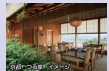
京都 つる家 イメージ