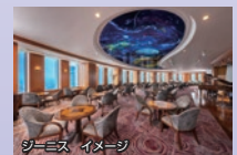
ジーニス イメージ