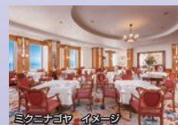
ミクニナゴヤ イメージ